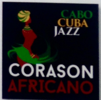
CaboCubaJazz Corason Africano Timbazol/Matismusic AFRO CUBAN JAZZ ****

Een Rotterdamse pro- ductie, van muziek die enerzijds de band met Kaapverdië vasthoudt, maar daar ook de muziek van Cuba in heeft verwerkt. Verder zijn er lijntjes naar